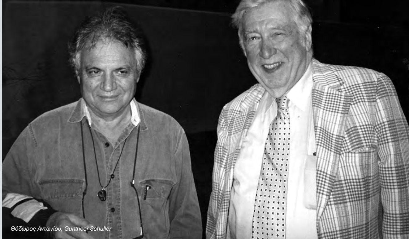
Θόδωρος Αντωνίου, Gunther Schuller

Στις 21 Ιουνίου του 2015, έφυγε από κοντά μας μία μεγάλη μουσική προσωπικότητα, ο Gunther Schuller, μέγας φίλος και μέντορας μας.