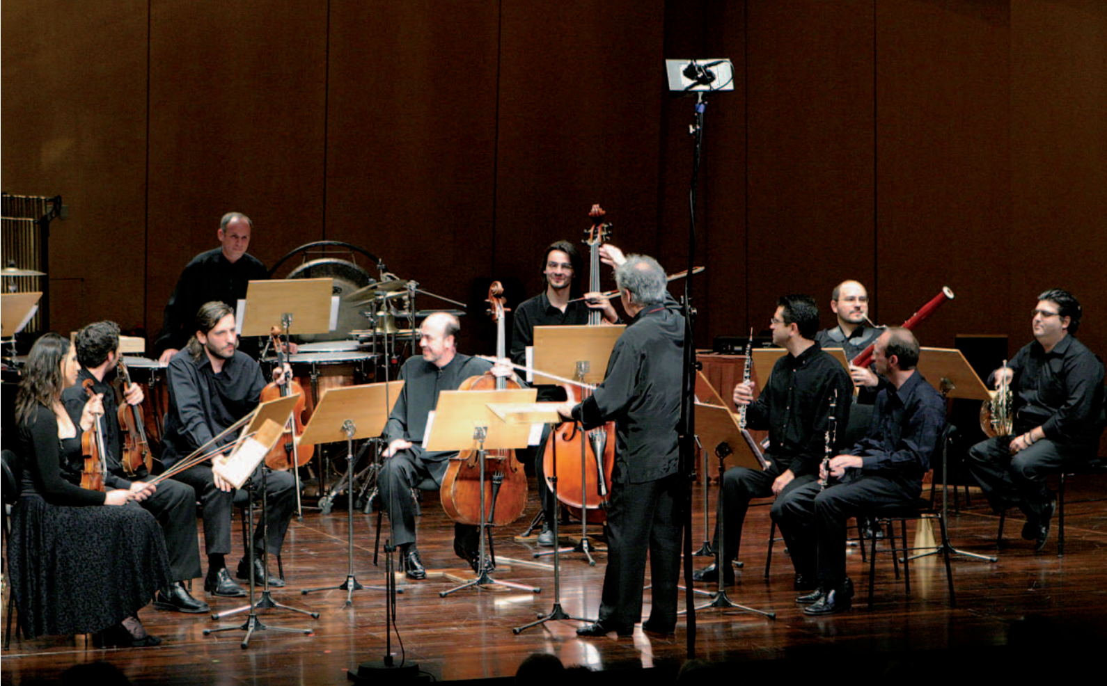
Ο Θόδωρος Αντωνίου και το Ελληνικό Συγκρότημα Σύγχρονης Μουσικής