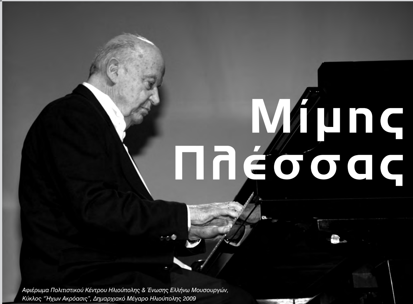
Αφιέρωμα Πολιτιστικού Κέντρου Ηλιούπολης & Ένωσης Ελλήνων Μουσουργών, Κύκλος "Ήχων Ακρόασις", Δημαρχιακό Μέγαρο Ηλιούπολης 2009

Ολοκληρώνοντας τη δημοσίευση αποσπασμάτων της συζήτησης που είχαμε με τον Μίμη Πλέσσα, είμαστε δυστυχώς υποχρεωμένοι να επιλέξουμε κάποια από ένα μεγάλο αριθμό θεμάτων που θα μπορούσαν να συμπεριληφθούν σε αυτή.